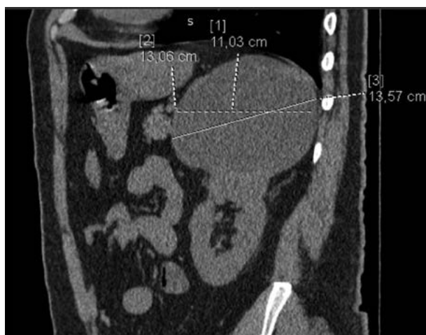
Рис. 2. Киста левой почки. Сагиттальный срез. Нанесены измерения в максимальном размере образования.