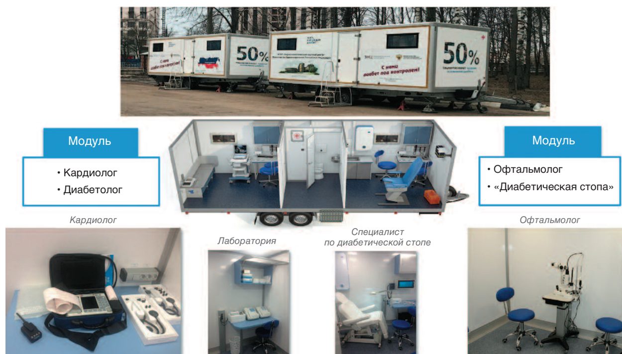
Рис. 1. Вид мобильного медицинского центра (Диамодуль), оснащенного специализированными кабинетами кардиолога, диабетолога, офтальмолога и специалиста по диабетической стопе, мини-лабораторией.

В 2019 г. были выполнены повторные выезды в Воронежскую область (первый выезд – в 2005 г.) и Краснодарский край (первый выезд – в 2006 г.). Пациенты были представлены случайной выборкой из баз данных региональных сегментов регистра СД. В анализ включены 1480 взрослых пациентов ( \geq 18 лет) с СД 1 и СД 2, из них 882 пациента были обследованы в 2005/2006 г. (337 пациентов – с СД 1 и 545 – с СД 2) и 598 – в 2019 г. (275 пациентов – с СД 1 и 323 – с СД 2). Все пациенты подписали добровольное информированное согласие.